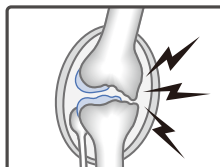
すり減った関節軟骨